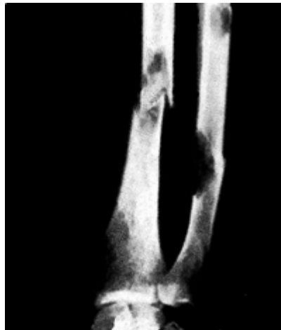
Abbildung 1: Myelomzellen im Knochenmark verursachen osteolytische Läsionen, die als „Löcher“ im Röntgenbild erkennbar sind. Geschwächte Knochen erhöhen die Wahrscheinlichkeit von Frakturen, wie das Röntgenbild eines Unterarms zeigt. (Aus: DeVita Jr VT, Hellman S, Rosenberg SA, eds. Cancer: Principles and Practice of Oncology . 5th ed. 1997:2350. Verändert mit Genehmigung durch Lippincott Williams & Wilkins).

Der am deutlichsten erkennbare Aspekt der Myelomerkrankung ist die Auswirkung auf die Knochen im ganzen Körper. Bei den meisten Patienten mit Multipltem Myelom entwickeln sich Aufweichungen dort, wo die Knochenstruktur angegriffen ist. Diese können sich vom Inneren mit dem Knochenmark bis zur Außenseite des Knochens erstrecken. Die weichen Stellen erscheinen als „Löcher“ auf dem Röntgenbild und werden als „osteolytische Läsionen“ bezeichnet (siehe Abbildung 1). Diese Läsionen schwächen den Knochen, verursachen Schmerzen und erhöhen das Risiko von Frakturen.